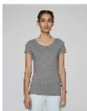
Stella Loves Modal