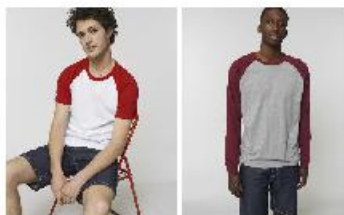
Catcher Short Sleeve Catcher Long Sleeve