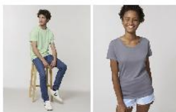
Creator Stella Expresser