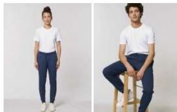
Stella Tracer Denim Stanley Stepper Denim